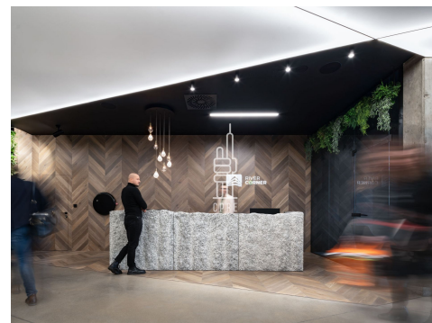
First floor 1. patro 2. NP