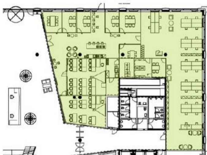
přízemí | ground floor